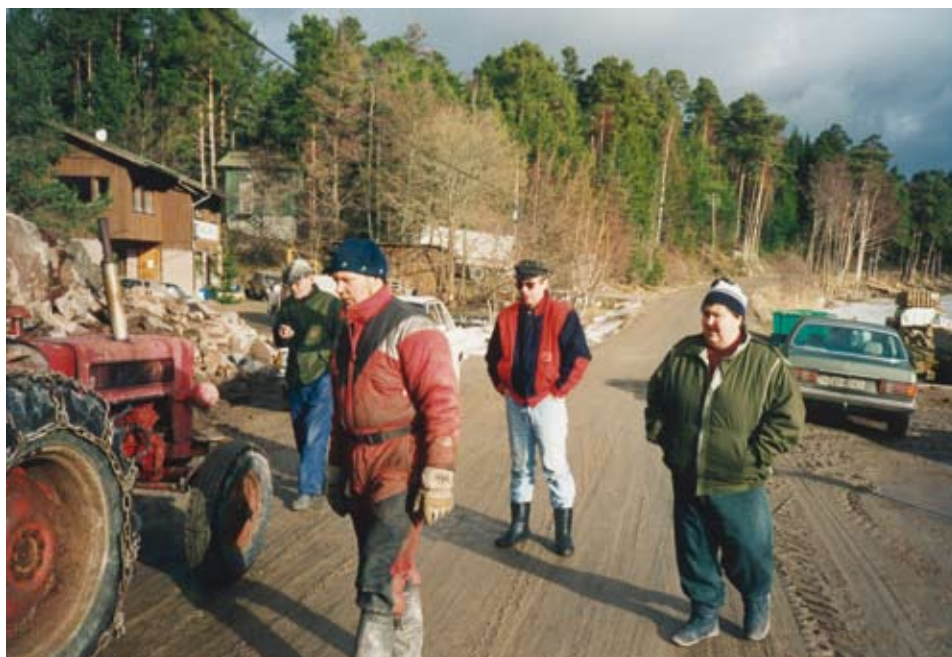
Vägen i Kirjais under arbete.

D et tog bara ett år att förverkliga vägprojektet i Kirjais. Byborna hittade entusiasmen och lyckades bevara den. Utöver detta räckte entusiasmen till ytterligare ett projekt: en småbåtsfarled. I båda satsningarna kunde entusiasmen ha dämpats av petiga myndigheter och direktiv. Med kunskap i ryggen, ett helhjärtat engagemang och ett gott förhandlingshumör höll de ångan uppe. Och lyckades.