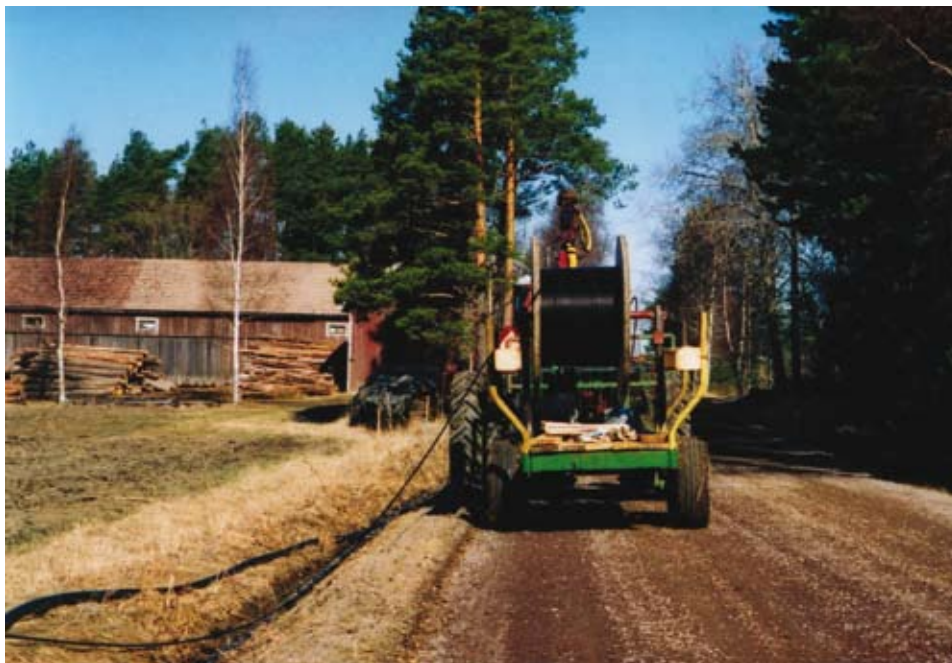
Fiberkabel rullas ut i dike i Hindersby.

F ibernät avgör om unga kan och vill flytta tillbaka till landsbygden. Men tro inte att marknadskrafterna tar hand om landsbygden, säger Nisse Husberg i Hindersby, där bönderna byggt ett eget fibernät.