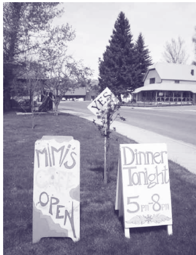
Rösta ja för hälsostationen (och kom på middag)!

I dylika fall krävs också höranden. Det måste hållas två möten för allmänheten med representation för valmyndigheterna på county-nivå och gruppen som tagit initiativet. Där får folk komma till tals om förslaget. Dessutom skall alla självständiga towns (Halfway, Richland och Oxbow) inom området ge sitt bifall till