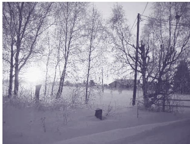
Gryning i byn...