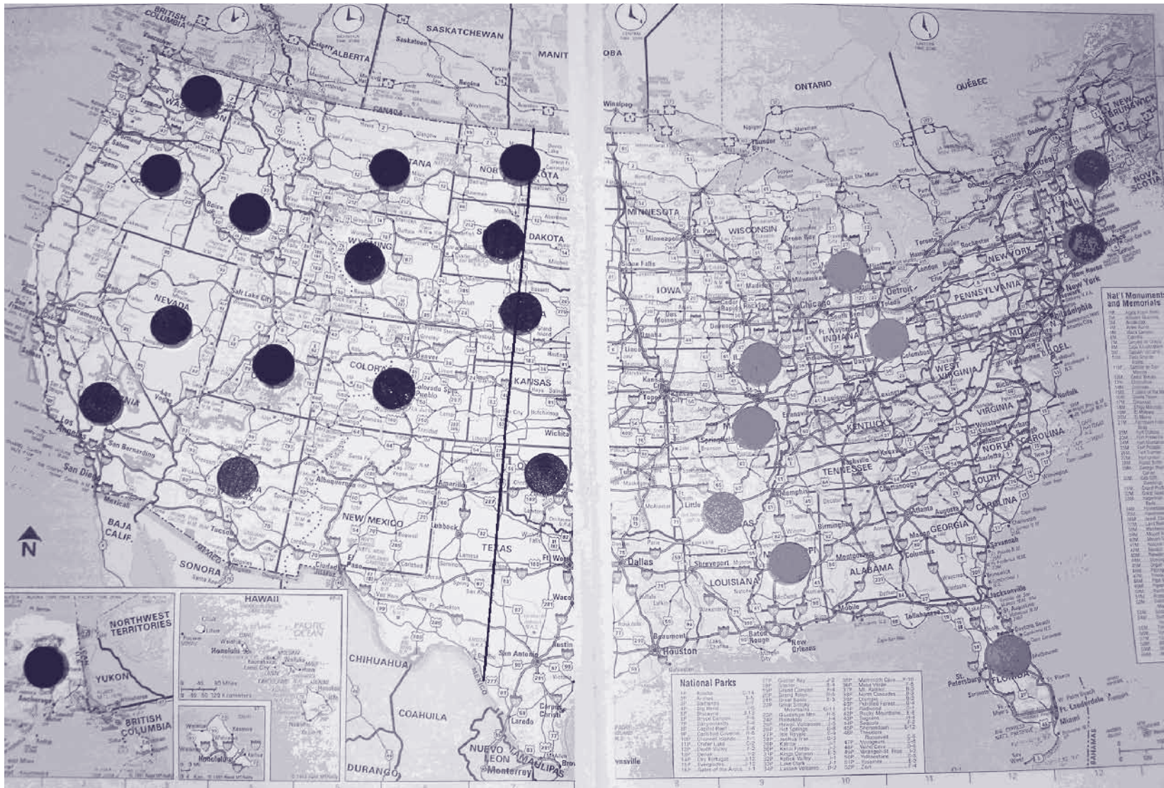
Karta med knappar på en soffa. Den omtalade hundrade longituden är ungefärligt utritad strax till vänster om kartbokens mitt.