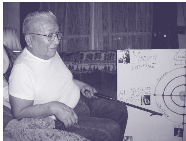
Här förklarar Shot in the eye (Nez perce indian) med en spiral hur livet ser ut..