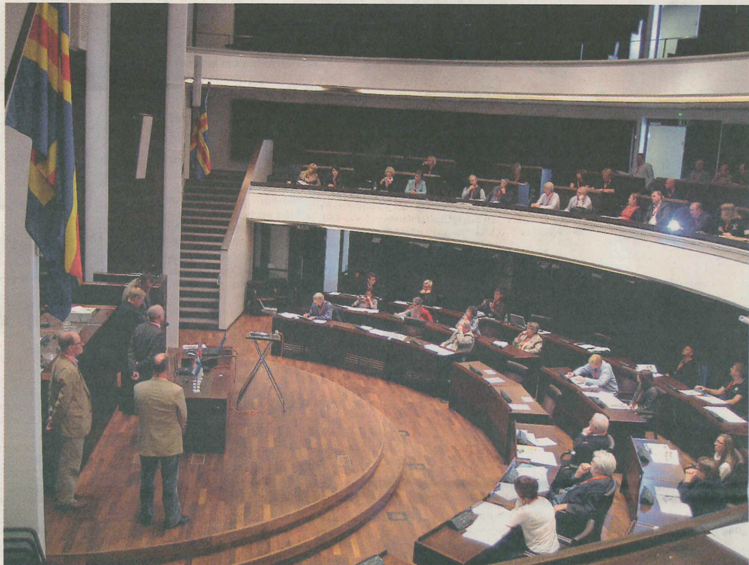
Framtidstron på landsbygdens utvecklingsförmåga var stor bland deltagarna under helgens landsbygdsriksdag. Resurser som landsbygden har väntas bli bristvaror i framtiden. Hur man kan vända det till en levande glesbygd var ett av diskussionsämnena.

Härmälä tog också upp de stigande matpriserna. Han menar att det är något i grunden positivt som kommer att göra jord-